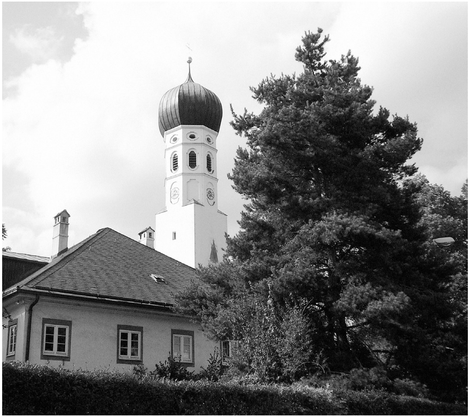
Church of St. Johann Baptist